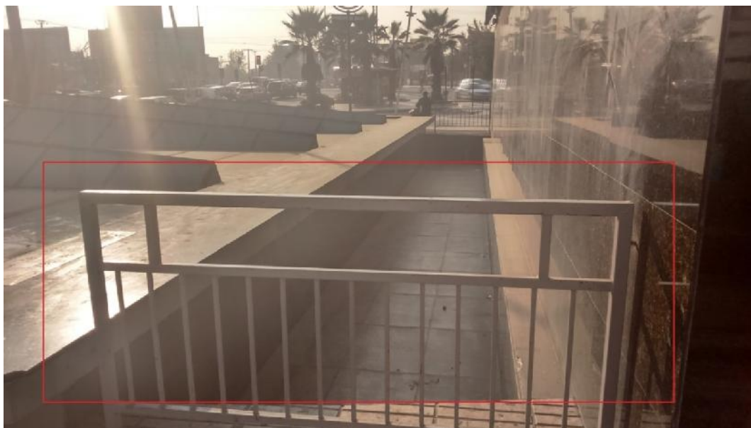
IMG. N°6: BARRERA DE PROTECCION ESTACION PRINCIPE DE GALES