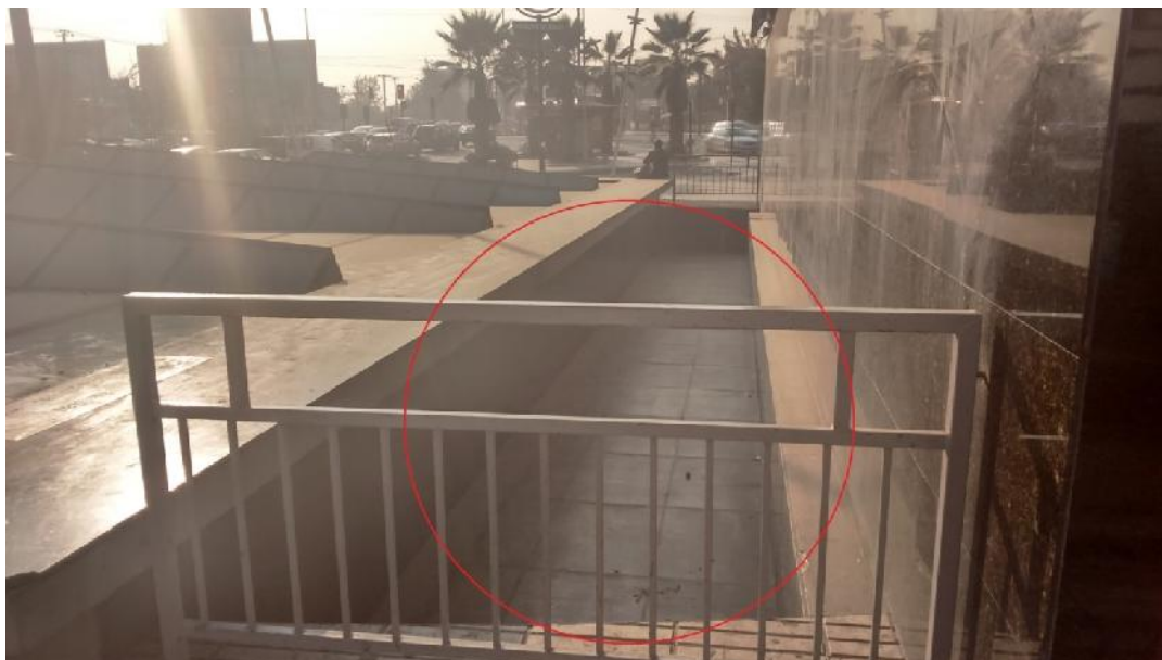
IMG. N°3: ESPEJO DE AGUA ESTACION PRINCIPE DE GALES

Utilizar imprimante Dynaflex L Primer y Membrana Imperfex Mineral 4.5K o Imprimante Vulkem Primer 171 y Membrana Vulkem 350.