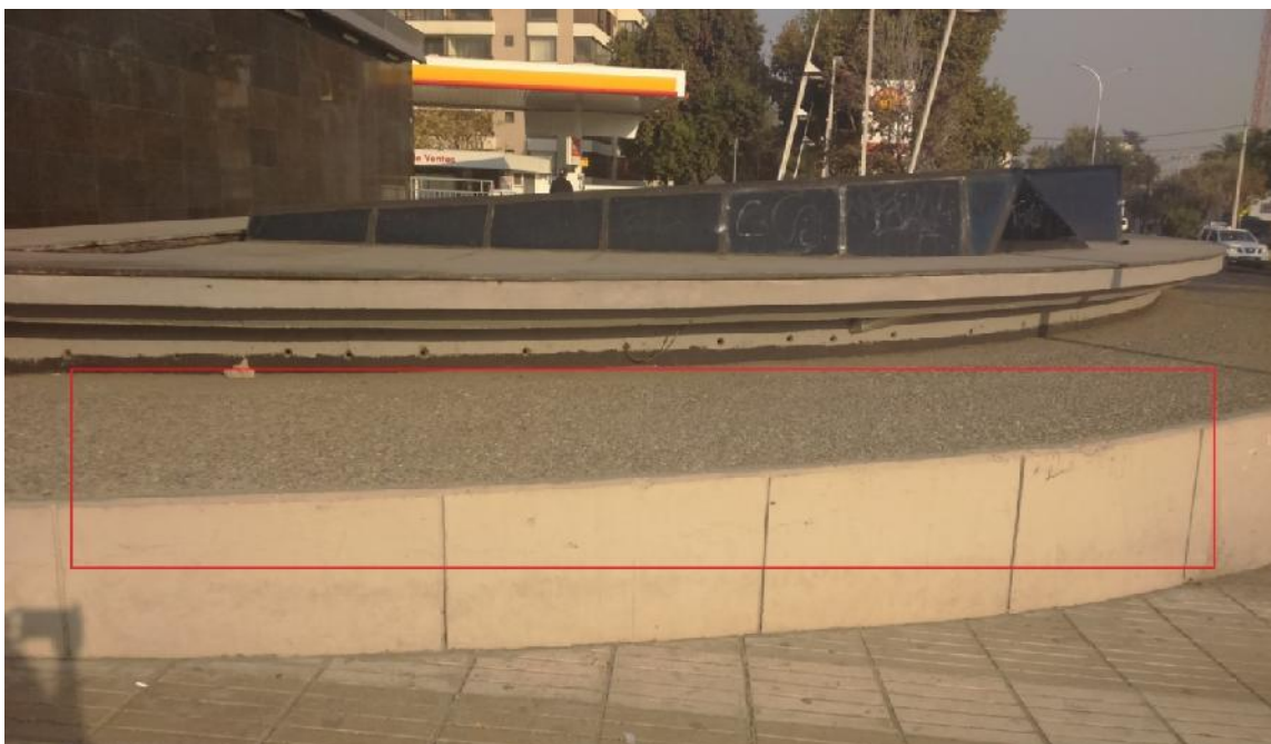
IMG. N°4: ZONA DE PISO ALEDAÑA A LUCARNA ESTACION PRINCIPE DE GALES

No existe especificación, ni información de código comercial de las baldosas existentes, por lo que el proveedor buscará el producto que más se asemeje y lo presentara al Jefe de Proyecto para su aprobación.