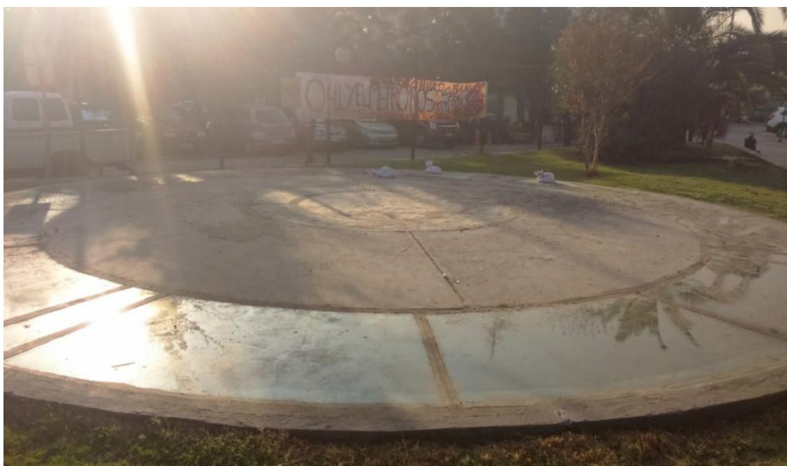
IMG. N°2: LUCARNA ESTACION PLAZA EGAÑA