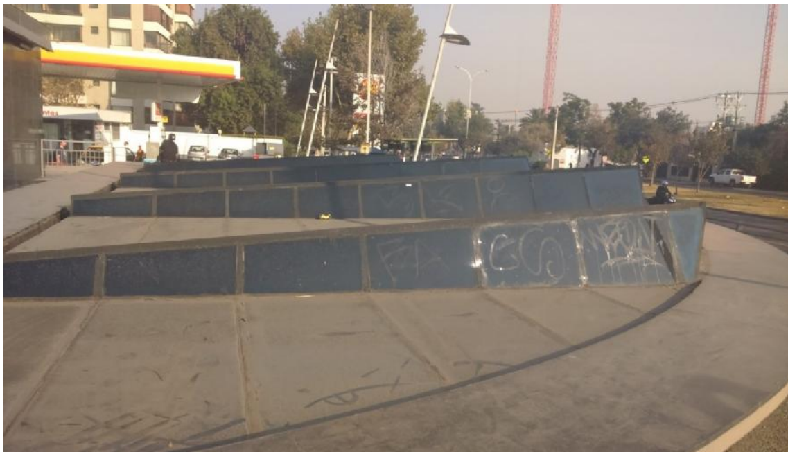
IMG. N°1: LUCARNA ESTACION PRINCIPE DE GALES